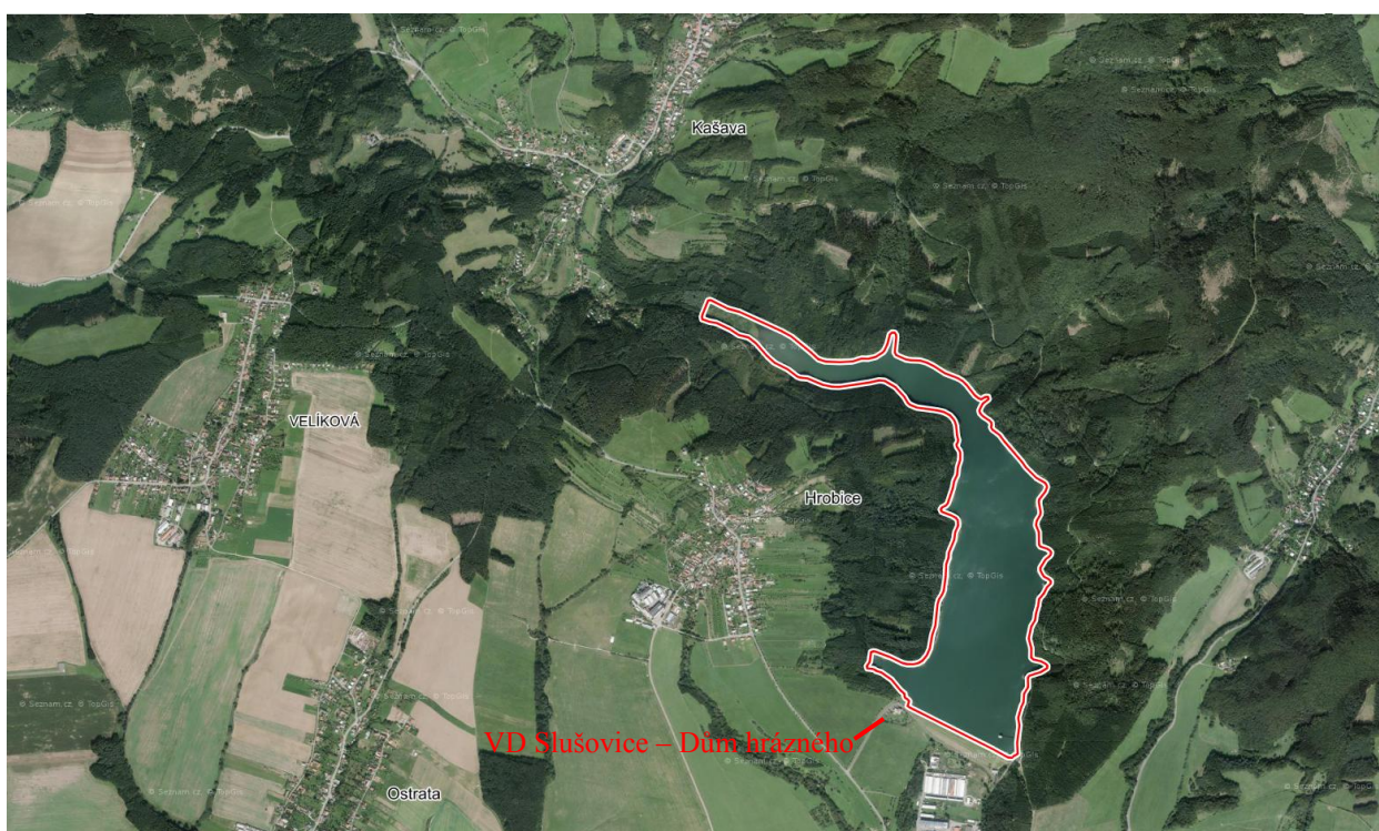
Letecký snímek s označením Domu hrázného VD Slušovice